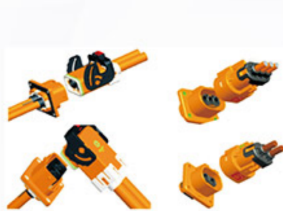
高壓連接器 EV HV CONNECTOR