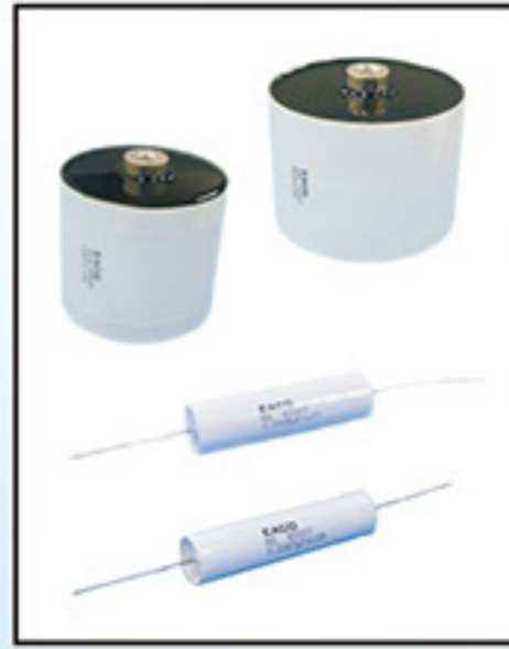
High Voltage 4000-15000VDC