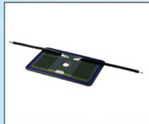
100W-900W 不鏽鋼功率電阻器