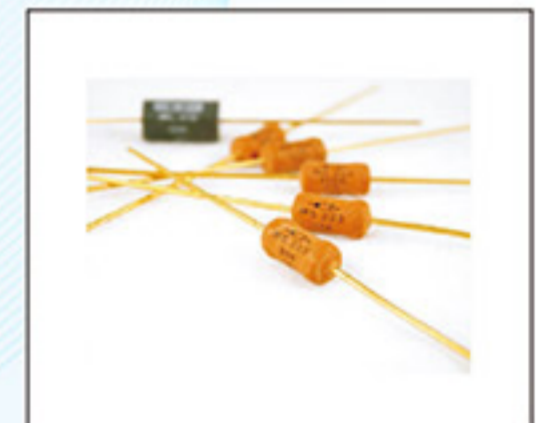
Precision power film Resistors +275 C Maximum Temperature RESISTOR MS