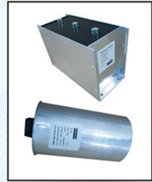
AC Filter 400-1000VAC