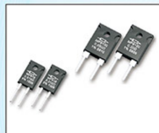
Power resistors, Heat sink Mountable with Non-Inductive Designs RESISTOR MP9000