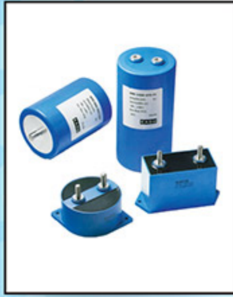
DC Link 15-6000 uF